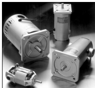
整流子モータ DCマグネットモータ